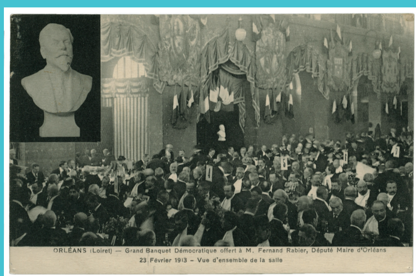
1- Orléans - Grand Banquet Démocratique offert à Fernand Rabier, député maire d'Orléans, 23 février 1913 - Vue d'ensemble de la salle. Arch. dép. du Loiret, 11 Fi 4669

Les interactions entre les différents échelons de décision politique sont nombreuses et diverses : législation descendante vers les collectivités territoriales, financement des projets locaux par des instances supérieures, participation du département et des communes à des initiatives nationales ou européennes... À partir de la fin des années 1950, la mise en place des politiques européennes contribue ainsi à la modernisation des campagnes loirétaines grâce à des subventions accordées à des projets de remembrement, d'assainissement des eaux et de développement de la filière agroalimentaire.