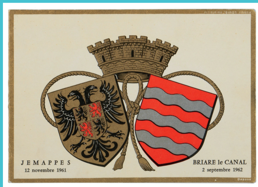
4- Carte commémorative « Jemappes 12 novembre 1961 - Briare-le-Canal 2 septembre 1962. Jumelage des villes belges et françaises de Jemappes (Hainaut) et Briare-le-Canal (Loiret) ». Arch. dép. du Loiret, 5 Fi 851