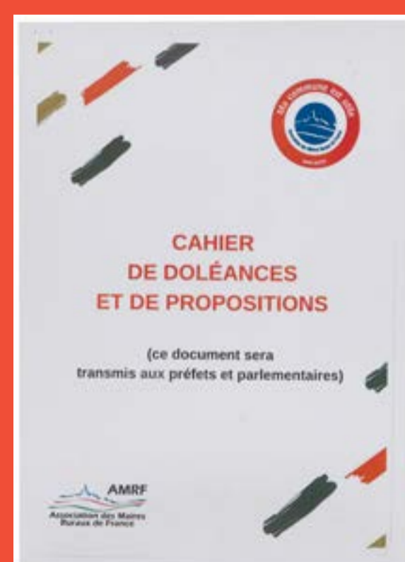
4 - Cahiers citoyens de Neuvy-en-Sullias, Grand débat national, 2019 Arch. dép. du Loiret, 1800 W 8

À la suite du mouvement des Gilets jaunes, les Français ont été sollicités en 2019 pour rédiger des cahiers citoyens en amont d'un Grand Débat national, processus qui évoque celui des cahiers de doléances de 1789. Celui de Neuvy-en-Sullias témoigne à la fois de la forme très libre des contributions et de la diversité des sujets auxquels les citoyens sont désormais sensibilisés : souhait d'une démocratie plus participative, d'une plus grande justice fiscale, de services adaptés aux besoins de la population, d'une prise en compte accrue des questions environnementales... Enrichie de nouveaux thèmes et de nouvelles modalités de diffusion, l'expression citoyenne participe activement à la vie démocratique de la France.