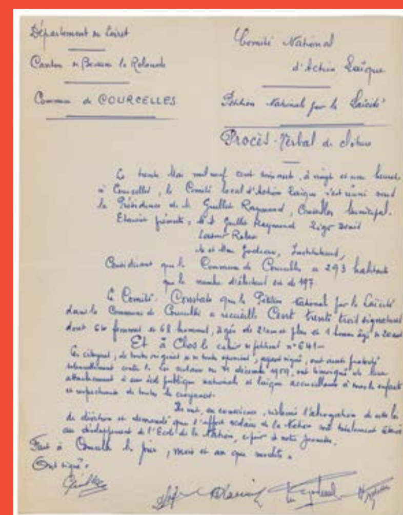
3 - Pétition contre la loi scolaire du 31 décembre 1959 Archives de la commune de Courcelles, 379 O-SUPPL 1 R 18