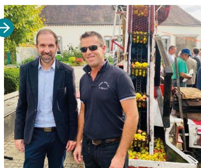
23 octobre Fête de la pomme à Paucourt