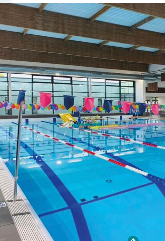
14 octobre Inauguration du centre aquatique Claude-Blin à Châlette-sur-Loing