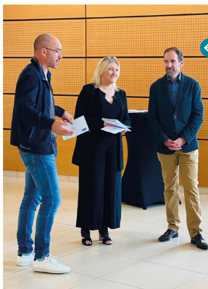
24 septembre Remise des chèques aux associations sportives du canton