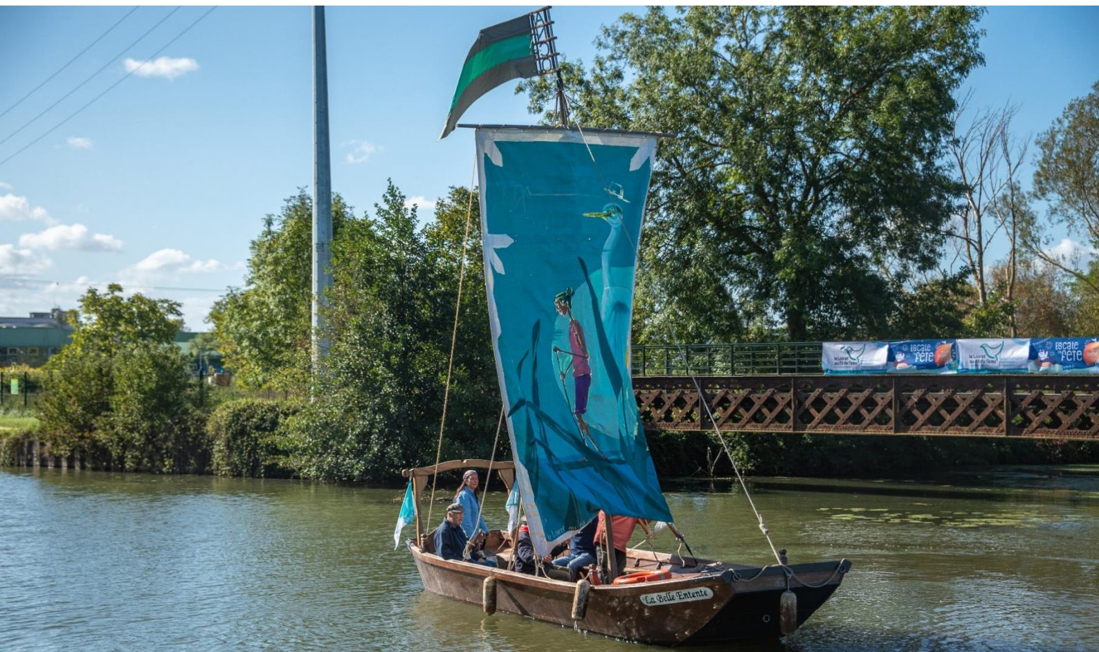
Voile de l'édition 2022

Ces voiles deviendront des emblèmes de l'itinéraire touristique à voir et revoir au gré de la navigation des bateaux.