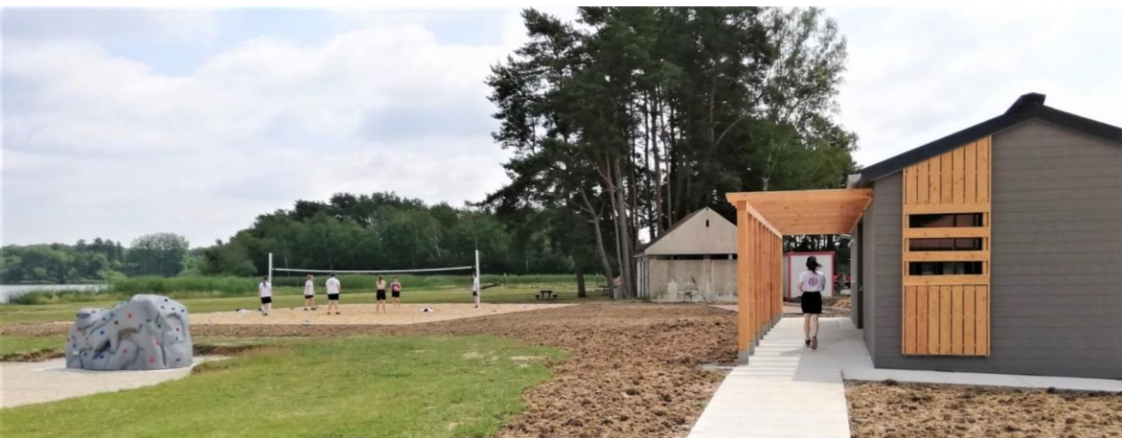
Vue sur les nouveaux aménagements à l'étang de la Vallée

Convaincu du potentiel touristique de cet étang de 70 hectares, le Département a réalisé en 2021 d'importants travaux de réhabilitation de la plage et de ses abords, pour un montant total de 750 000 euros (assainissement, destruction et reconstruction du bloc sanitaire, amélioration de la circulation sur le parking, mise en œuvre de jeux de plein air). En 2023, le Département lance les études pour requalifier la base de loisirs de l'étang des Bois à Vieilles-Maisons-sur-Joudry.